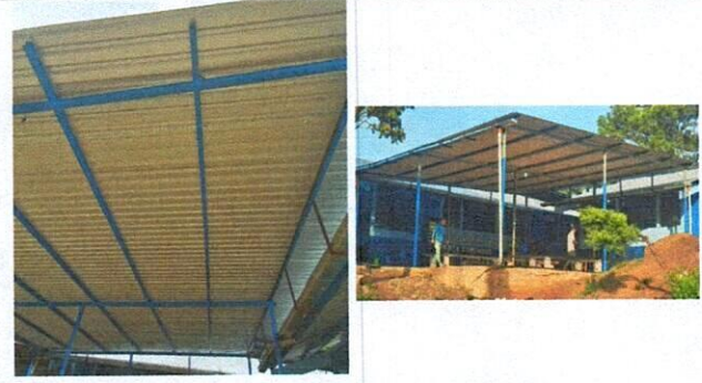
Foto 2: finalización del trabajo colocación de laminas nuevas para el corredor de la escuela