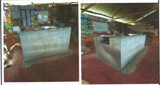
Foto 4: finalizacion del polleton reconstruido para la cocina de la escuela