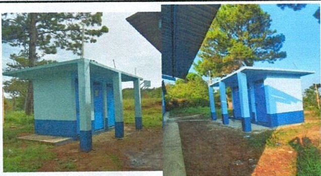
Foto 3: finalizado trabajo de cernido y pintura interior y exterios de baños.