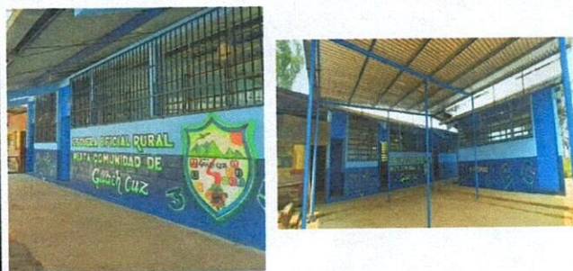
Foto 5: finalizacion de colocación de balcones para las ventanas frontales de la escuela