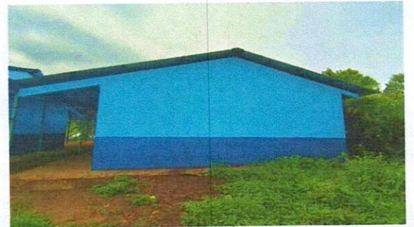
6: finalización cernido de pared. Para evitar filtracion de agua en la pared.

Observación: Si es necesario se pueden agregar hojas adicionales y número de hojas.